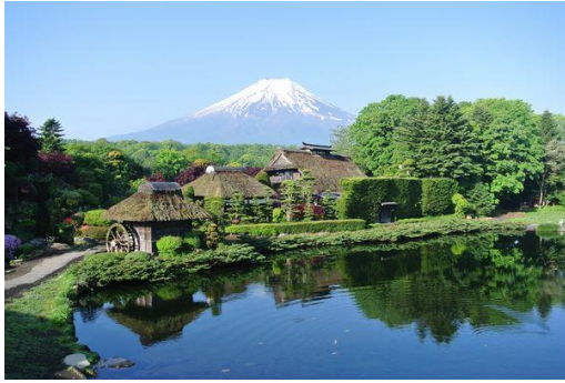
忍野八海 (イメージ)