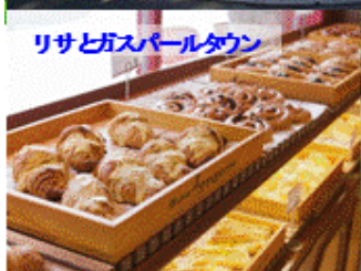
リサとガスパールタウン