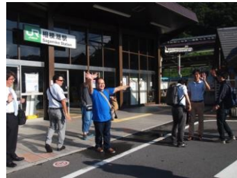
相模湖駅 7:42 発の電車で出社