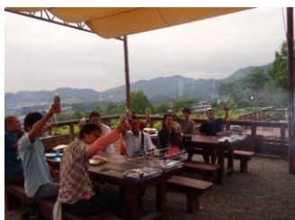
6:30 乾杯・BBQ スタート