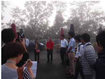
6:30 開会宣言と自己紹介