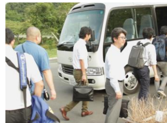
7:25 相模湖駅へ向かって出発!