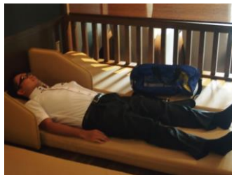
7:15 お休み処で寝てしまう方も…