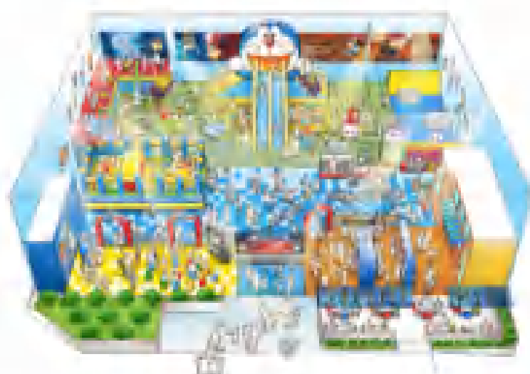
完成イメージ(内観)