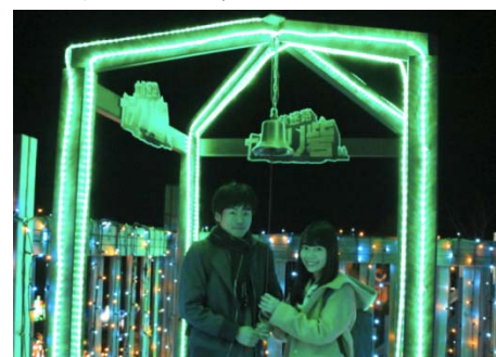
カラクリ砦頂上のイルミネーション