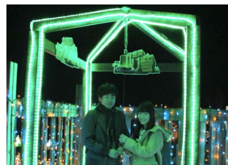
カラクリ砦頂上のイルミネーション