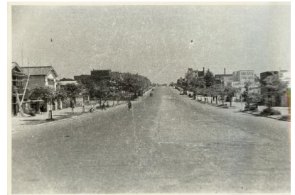
参考写真:1953年頃の表参道

1923年(大正12年)の関東大震災後、住宅の供給を目的に組織された財団法人同潤会が、表参道沿いに、日本初の鉄筋コンクリート製アパートの建設が始まりました。それが、「同潤会青山アパート」です。完成した1927年(昭和2年)の当時は、軍人、役人、大学教授などしか入居できない高級アパートで、庶民には高嶺花でした。また、新しい「表参道」の名所として人気スポットにもなりました。