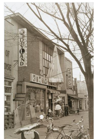
1960年代のキデイランド

キデイランドも、1966年(昭和41年)には本店ビル(地上6階地下2階)を竣工し、キデイランド原宿店のブランドは国内外のお客様に日本を代表する玩具店として認識されるようになりました。