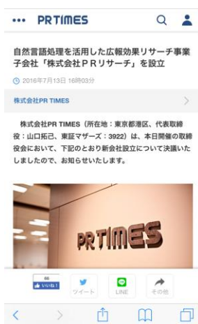
PR TIMES スマートフォン版 シェアボタン「その他」展開前後の画面

前述のビジネスチャットアプリを利用中のユーザーはより手軽でタイムリーに、自社プレスリリースや競合他社プレスリリースなどを特定のグループへ情報共有することができます。