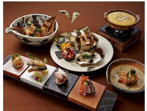
コース料理イメージ

店 名 瓢箪坂 おいしんぼ (ひょうたんざか おいしんぼ) 所在地 〒162-0816 東京都新宿区白銀町2-3 電 話 03-5579-2131 F A X 03-5579-2132 営業時間 ランチ 11:30～15:00 (LO14:00) ディナー 17:00～23:00 (LO22:00) オープン日 2014年10月16日(木) 定休日 日曜日 席 数 65席 客 単 価 ランチ 1,500円 / ディナー 5,500円 最 寄 駅 東京メトロ神楽坂駅（神楽坂口より徒歩5分）