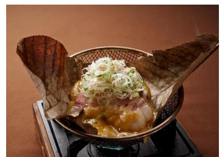
「松坂豚の松坂豚の朴葉トリュフ味噌焼き」