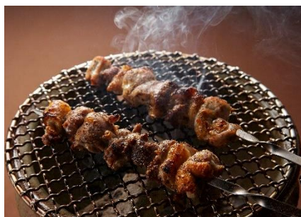
「ホロホロ鳥の串焼き」