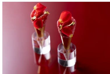
ルプタンの赤を視覚に刺激的に取り込んだスイーツメニュー