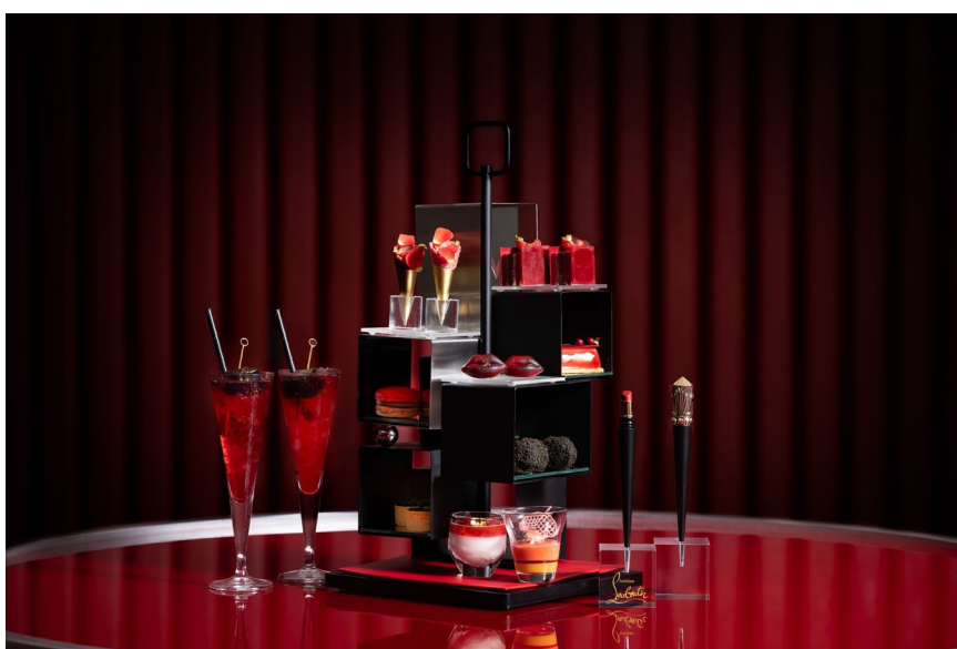
"ルージュスティレット" アフタヌーンティー

ラグジュアリー・ライフスタイルホテル W大阪(所在地:大阪市中央区南船場4丁目1番3号、総支配人:近藤 豪)は、2023年12月1日(金)～2024年1月31日(水)までの期間限定で、昨年に続く第2弾となるクリスチャン ルブタン ビューティとのコラボレーション、「ルージュスティレット」アフタヌーンティーの提供を開始いたします。御堂筋が煌めくフェスティブシーズン、エレガントでグラマラスな赤い時間をお過ごしください。