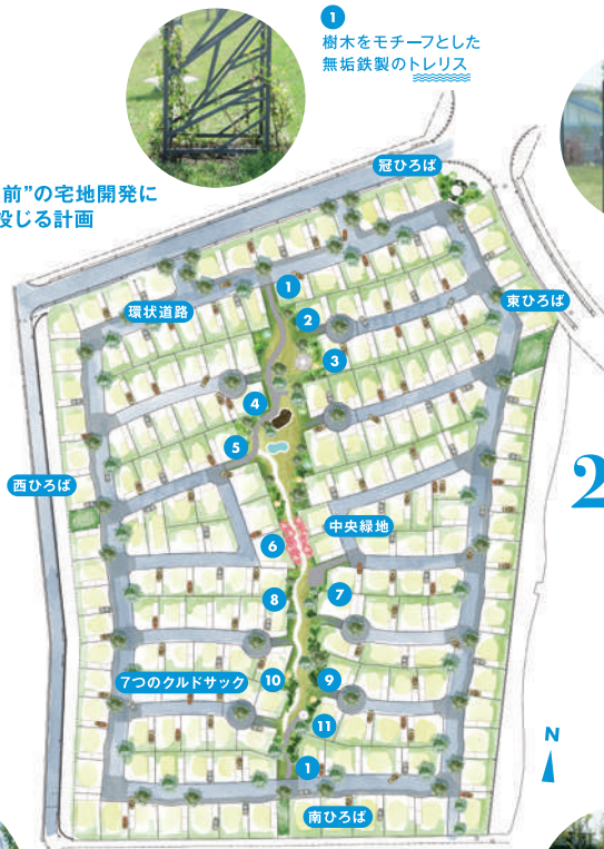
“街の骨格づくり”を念頭に入れた本計画