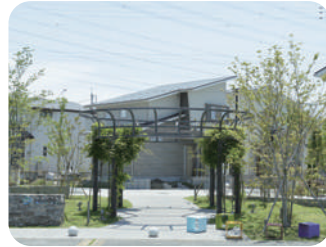
北側の交差点に位置し街の顔となる冠ひろば