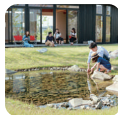
公共度の高い中央緑地内には集会所 やビオトープ池を含め様々なスケール や雰囲気「体験の場」が点在。