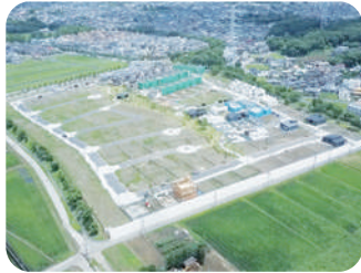
通過交通や車のスピードを抑制する 7つのクドサク(全体俯瞰写真)