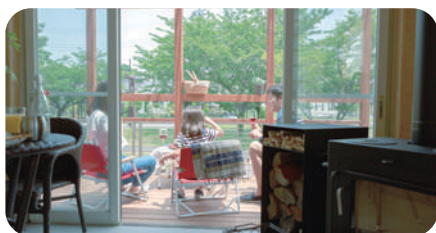
最もプライベート度の高い各戸内、 そして占有庭では家族や友人と寛ぐことができる。