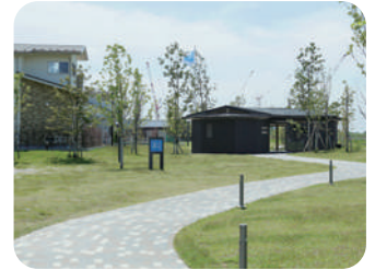
整備された庭園というより野趣に富んだ 野っ原を意識した中央緑地