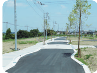
街のシークエンスが生まれるべく緩やかな カーブを描く環状道路