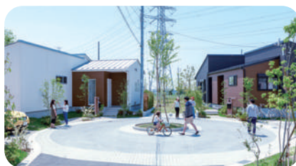
宅地に囲まれた7つのクドサクでは それぞれの宅地部の住民同士がシンボルツリーの周りで 季節を感じながら声を掛け合う。