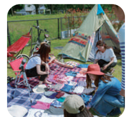
各広場ではフリーマーケットや キッチンカーを導入したイベント 等で住民以外の方も訪れる。