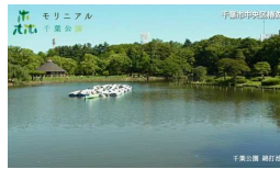
モリニアル八千代緑が丘 千葉県千葉市八千代緑が丘 midorigaoka.moriniaru.com