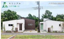
モリニアル千葉公園 千葉県千葉市中央区千葉公園 chibakouen.moriniaru.com