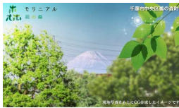
モリニアル若松台 千葉県千葉市中央区若松台 wakamatsudai.moriniaru.com