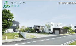
モリニアル八千代緑が丘 千葉県千葉市中央区八千代緑が丘 midorigaoka.moriniaru.com