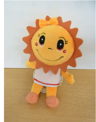
<特製サニーちゃんぬいぐるみ>