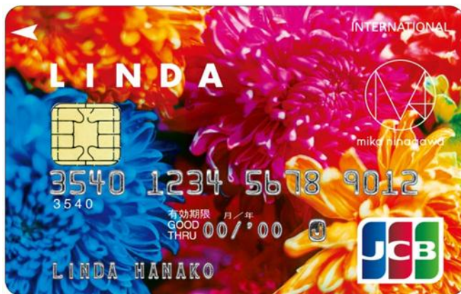
「JCB LINDAカード」 「蜷川実花さん」の写真を使用した「M / mika ninagawa 限定券面」