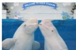
横浜・八景島シーパラダイス アクアリゾートバス 大人・ 高校生以上 3,300円→2,800円