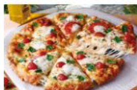
PIZZA-LA ピザを含む4,000円以上のご注文1回で 500円割引