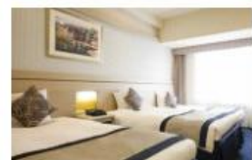
ホテル京阪 ユニバーサル・ タワー 大人一名様1泊2名1室 5,800円～