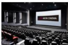
イオンシネマ シネマチケット(カード) 一般 1,800円→1,300円