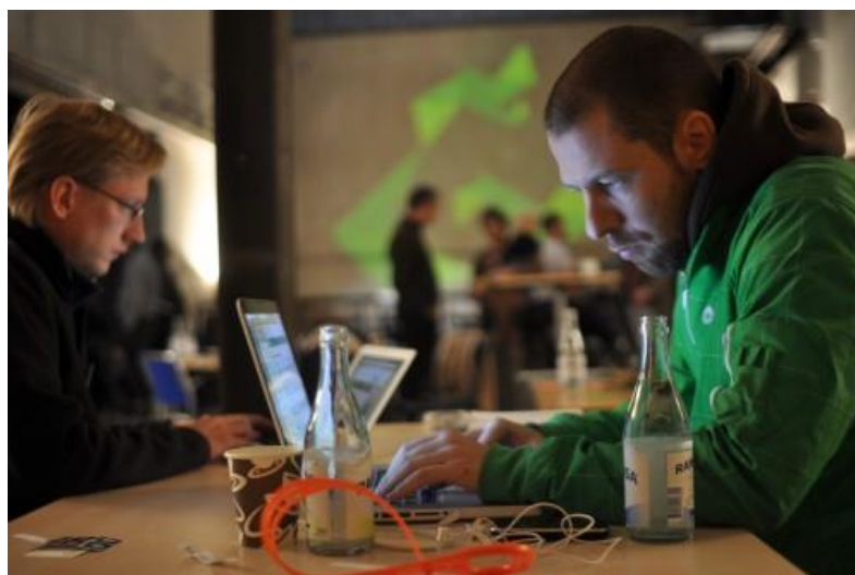
※London Green Hackathon: Web サービス開発の様子

環境問題を解決するためには、ストイックに省エネルギー・省資源に取り組むことも重要ですが、本 GreenHackathon では、環境への考慮だけでなく「ユーザーフレンドリー」なプランや「クレイジー」なプランも募集しています。エコを「おもしろく」「身近に」感じさせるプランが生まれることを期待しています。一種の“お祭り”的な側面も持つ Hackathon の場で、エコの在り方を考える“次の一手”を見つけ出すための貴重な実験の場なのかもしれません。