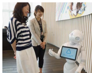
▲Pepperによる受付イメージ

リアル脱出ゲームセンター入り口にいるPepperと順番待ち管理アプリ『Airウェイト』が完全に連携することで、単に「会話をする」だけでなく、Pepperと会話をしていくだけで受付を済ませることができます。また、受付だけでなくリアル脱出ゲームの概要なども教えてくれます。うまく会話できれば、リアル脱出ゲームのヒントも教えてくれる…かもしれません。