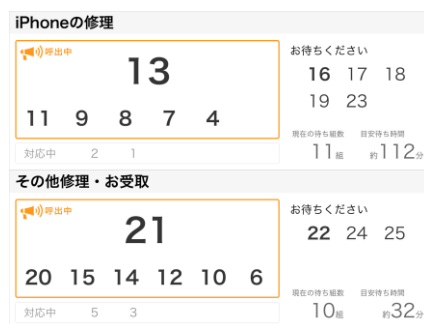
▲外部ディスプレイ表示イメージ

http://www.biccamera.co.jp/shoplist/shop-107.html