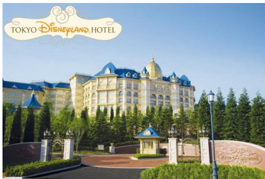
東京ディズニーランドホテル

夢のような空間で開催される、1日だけの「フェアリーテイル・ティーパーティー」では、ここでしか味 わえないプリンセステーマのスイーツや、デコレーション体験を通じて、特別なひと時をお楽しみい ただけます。