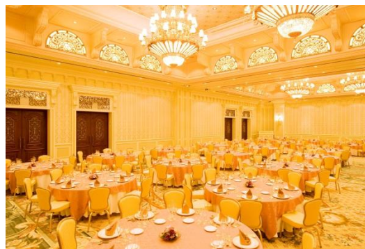
シンデレラドリーム (会場イメージ)