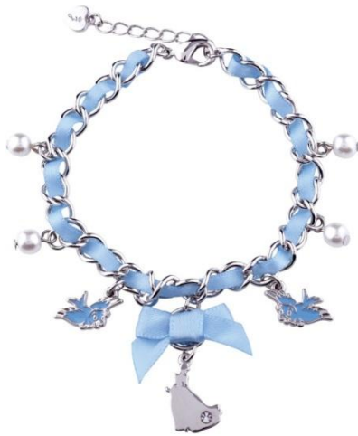
ディズニーストア 「Princess Collection ブレスレット シンデレラ」