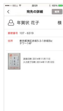
「宛名スキャン」で過去に届いた年賀状を撮れば、“宛先帳”としてデータ化されます