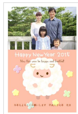
人気のデザインテンプレートのトップ10はカワイイ“羊”がデザインされ、写真が入られるものが中心