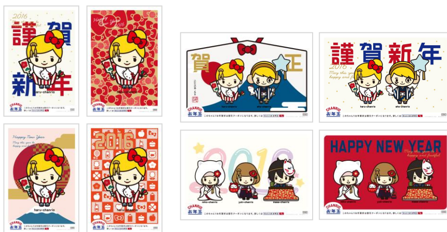
ひとり用「ちゃんりお年賀状」デザイン例