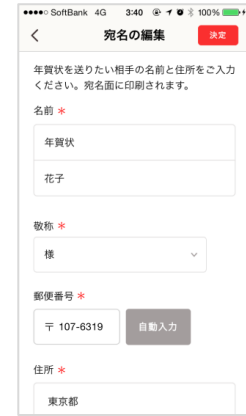
データ登録画面 通常、翌日には登録完了します