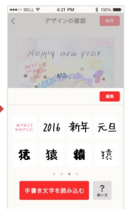
手書き文字の配置 スタンプ感覚で 手書き文字を配置するだけ