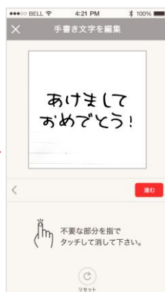
撮影画像の調整 写りこんでしまった 余計なものを削除