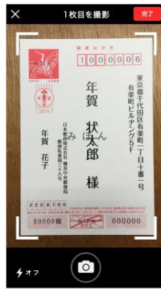
年賀状撮影画面 差出人欄を読み取ります