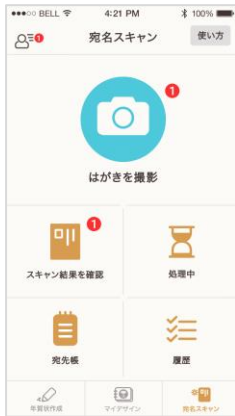
宛名スキャントップ画面 撮影も住所録もアプリで完結

昨年は 30 万枚もの年賀状の宛先が、「宛名スキャン」で登録されました。利用者の約 8 割が女性。管理が大変な住所入力に革命を起こしました。オペレーターによる手作業での入力のためデータは正確で、何枚でも無料でご利用頂けます。また、撮影された写真は暗号化などによって安全にデータ化いたします。データ化された宛先帳は来年にも活用できるので、来年も年賀状づくりが簡単になります。