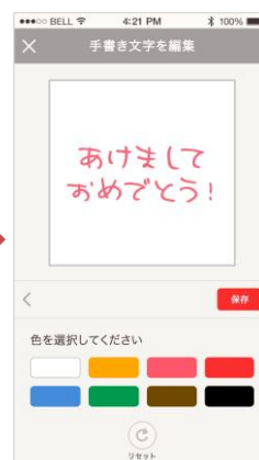
手書き文字の調整 色などを調整し完成