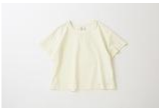
Blouse 【Graphpaper】 ¥18,000+tax