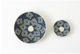
Basket ¥5,600+tax(left) ¥3,700+tax(right)