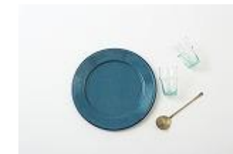
Plate ¥2,500+tax Glasses ¥700+tax Spoon ¥1,800+tax