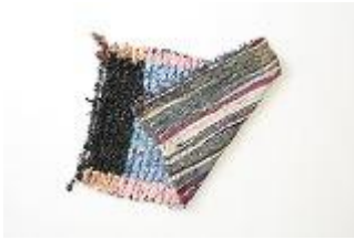
Vintage rug ¥12,000+tax