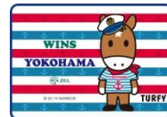
▲B賞 フリースブランケット