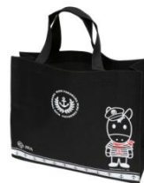
▲C賞 オリジナルバッグ