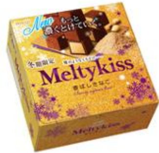
「メルティーキッス 香ばしきなこ」 参考小売価格:246 円(税別)