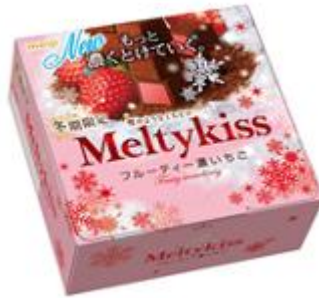
「メルティーキッス フルーティー濃いちご」 参考小売価格:246 円(税別)