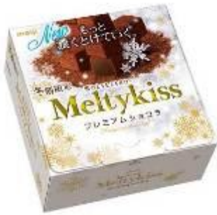
「メルティーキッス プレミアムショコラ」 参考小売価格:246 円(税別)

「Meltykiss」は、“雪のような口どけ”が特徴の冬期限定商品として多くの方に親しまれ、発売から22年目を迎えました。長年に渡って磨き続けてきた味わいは、「Meltykiss」ならではの贅沢です。口どけとともに広がる奥深い余韻をゆっくりとお楽しみいただけます。今年のラインナップは、“雪のような口どけ”×“カカオの濃厚感、華やかな香り”によって進化した味わいが楽しめる「メルティーキッス プレミアムショコラ」と、みずみずしい苺が味わえる「メルティーキッス フルーティー濃いちご」、2年前に発売し、短期間で品切れとなったきなこ味の進化版「メルティーキッス 香ばしきなこ」の3品です。