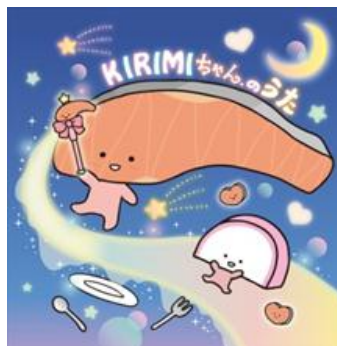
通常盤ジャケット写真