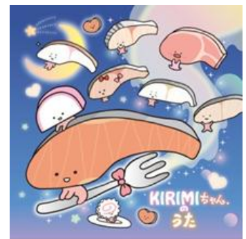
UNIVERSAL MUSIC ストア盤ジャケット写真