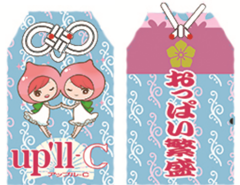
お守り イメージ(表)

ここでしか手に入らない、オリジナルデザインの「バストアップお守り」です。こっそり持ち歩いて、バストアップ祈願！