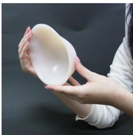
New アップルC 形状

バストアップはもちろん、「左右の胸の大きさのバランスを整えたい」、「垂れてきた胸を上向きにしたい」、「ダイエットで痩せてしまった胸を取り戻したい」という女性の様々なバストの悩みにアプローチし、日常生活の中で簡単にバストをエクササイズ/ケアできる商品です。