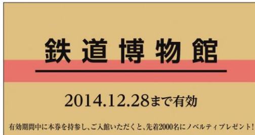
鉄道博物館オリジナル硬券