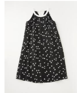
銀座限定商品:ドレス 税抜価格:195,000円 カラー:ブラック&ホワイト サイズ:36-44

エンポリオ アルマーニ銀座店では、オープンを記念し、「EMPORIO ARMANI FOR GINZA」のスペシャルタグがついた限定商品を発売します。メンズのレザーのシャツジャケットやジーンズ、Tシャツ、ベストの他、レディースはエレガントなレザージャケットやTシャツ、バッグ、シューズ、ハット、時計など種類豊富に展開します。ドレスはシルク・ビスコース素材、ブラック&ホワイトのバタフライプリントがフェミニンなデザインです。