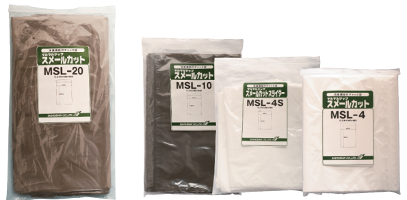
▲スメールカット各種商品

ある調査によると、在宅介護の場合は、使用済みのおむつなどを一時保管している割合が50.8%にのぼります。保管の際はスーパーのビニール袋等を使うのが一般的ですが、完全な密閉ができないために臭いが外に漏れ、部屋内に臭いが充満してしまうという問題点がありました。そこで登場したのが、チャックによる密閉 + 高い消臭機能に特化したジップ袋「スメールカット」です。