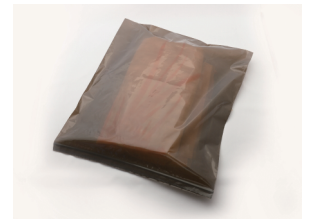
▲バスタオルを収納した場合