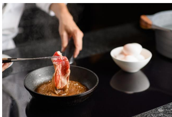
鹿児島県産黒毛和牛のすき焼き