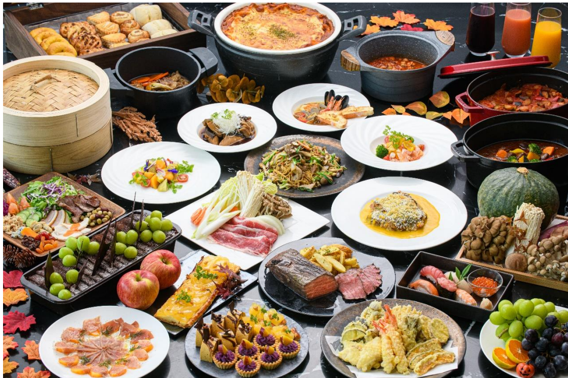
4階buffeレストラン「Daily Social (デイリーソーシャル)」の秋限定buffe 料理イメージ