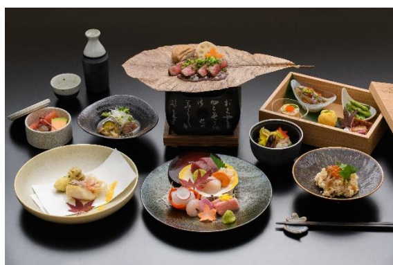
料理長おまかせコース「さくらじま」10,000円 イメージ