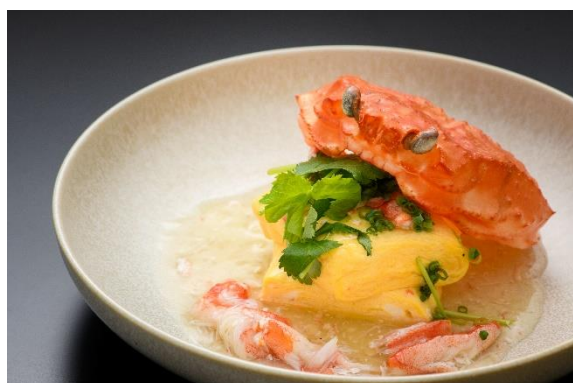
「地鶏鰹出汁の出し巻き 蟹あんかけ」1,800円 イメージ

ご予約：<電話>099-821-1111 <WEB> https://www.opentable.jp/r/satsumagma-kagoshima