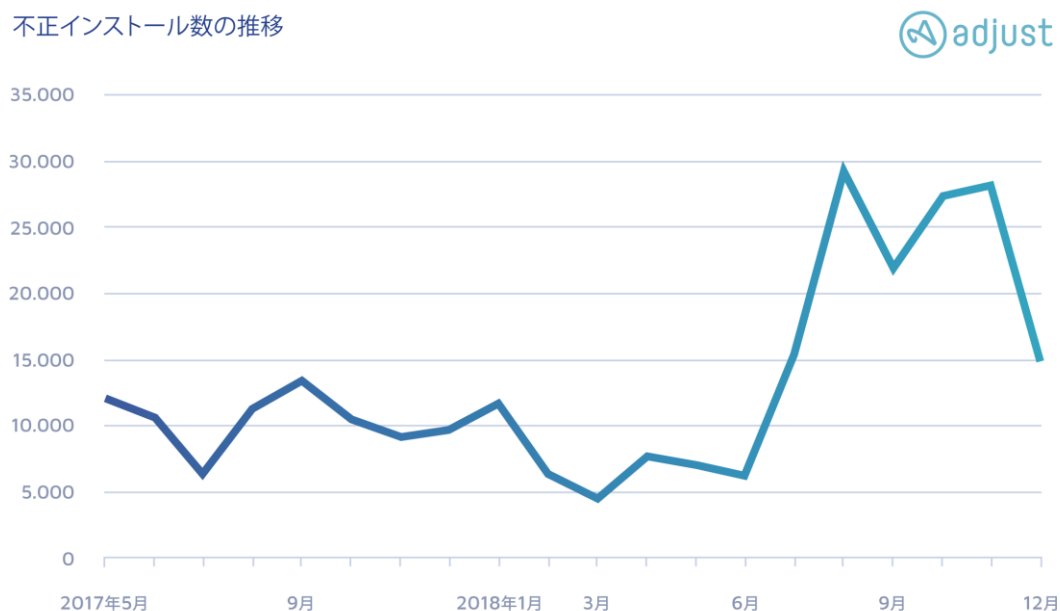
不正インストール数の推移