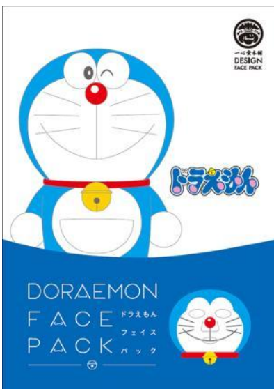
© Fujiko-Pro, Shogakukan, TV-Asahi, Shin-ei, and ADK

『ドラえもん フェイスパック』 『まる子 フェイスパック』 『永沢君 フェイスパック』