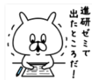
14進研ゼミで出たところだ