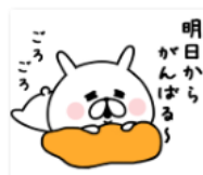
13明日からがんばる