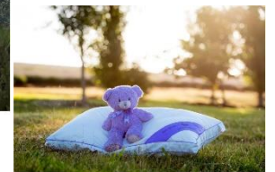
▲Bobbie the Bear