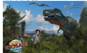
▲大恐竜時代へGO!!