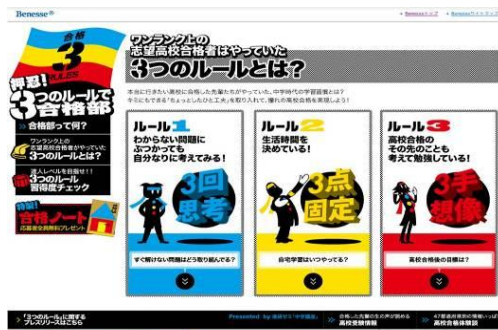
< 画像 4: 「3つのルール」紹介ページ イメージ >