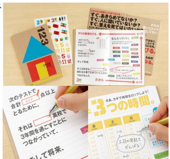
<画像2:特製「合格ノート」>