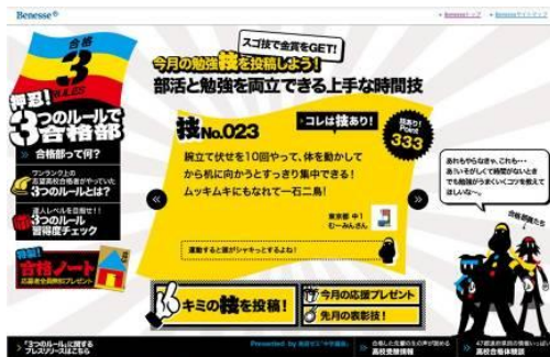
< 画像 3: サイト TOP イメージ >