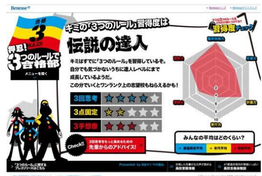
<画像1:「3つのルール」習得度チェックの結果例>

「3つのルール」の実践をサポートする特製合格ノート(画像2)を希望者全員にプレゼントします。書き込み式で、毎月の目標や振り返りなどを記入できます。このノートに沿って毎日の学習を進めていけば自然と学習習慣が身につきます。楽しく実践するためのオリジナルシールも付いています。(2011年3月31日まで)