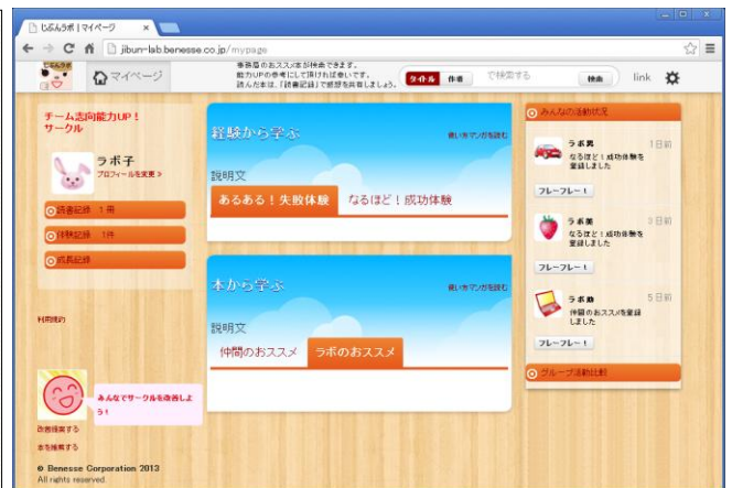
学び合い SLS(ソーシャルラーニングサービス) *グループ別に成功、失敗談や書籍情報を掲載