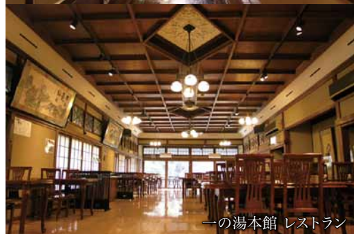
一の湯本館 レストラン