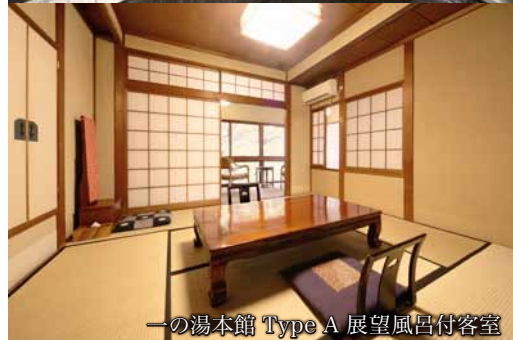
一の湯本館 Type A 展望風呂付客室