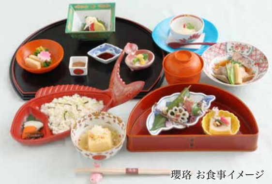
環路 お食事イメージ