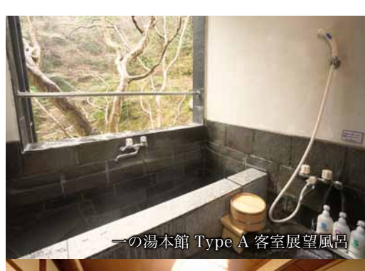
一の湯本館 Type A 客室展望風呂