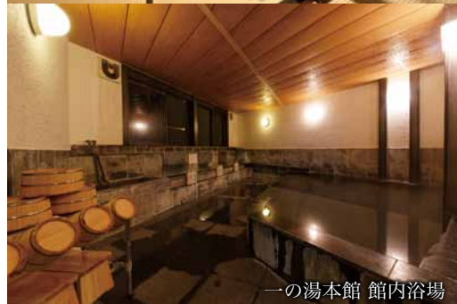
一の湯本館 館内浴場