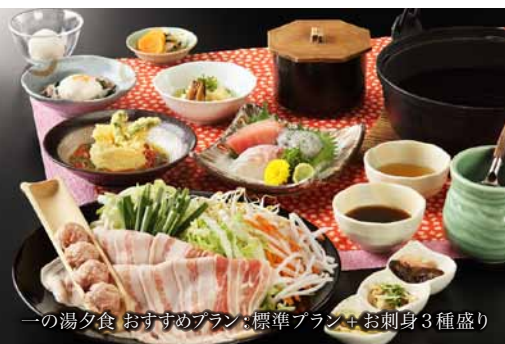
一の湯夕食 おすすめプラン：標準プラン+お刺身3種盛り