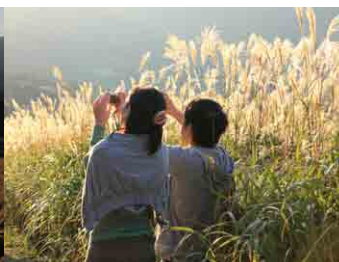
仙石原すすきの草原