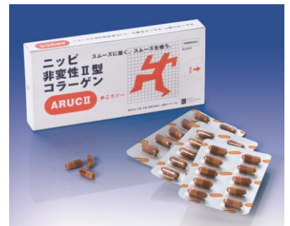
ニッピ非変性Ⅱ型コラーゲン ARUCⅡ(歩こうツォー)

本商品は、日本国内コラーゲン原料シェアNo.1のニッピが製造した、純国産・高純度の「非変性Ⅱ型コラーゲン」であり、国内の養鶏場で管理・育成されたニワトリの剣状軟骨を使用した商品です。食事などでは、摂取することが難しい非変性Ⅱ型コラーゲンを、特許出願済の新製法で粉末化。これにより高純度の単分子化したⅡ型コラーゲンのサプリメントを実現。更に、違和感を滑らかにするノビレチンも配合しました。