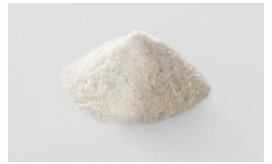
ニッピコラーゲン化粧品が精製したII型コラーゲンの粉末

II型コラーゲンは、体の節々にある成分の一つで、元気な生活を送る上で大切な“スムーズな動き”の役割を担う主成分です。