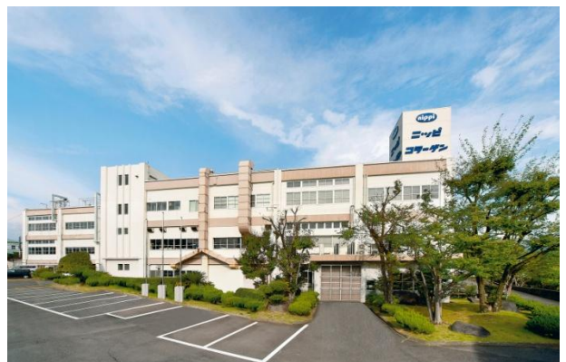
ニッピコラーゲン工業 富士宮工場

国内でサプリメントとして流通しているものは外国産がほとんどです。それも、軟骨を砕いただけの不純物を多く含んだ状態のものが主流です。