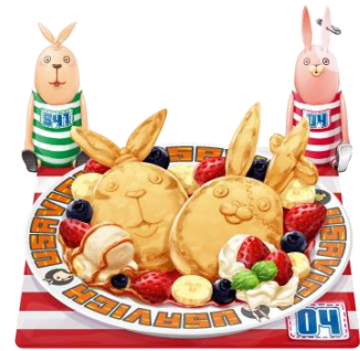
ウサビッチスィールニキ

© 2015 Viacom International Inc. All Rights Reserved. (コラボアイテム一部紹介)