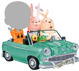
モスクビッチに乗ってドライブ