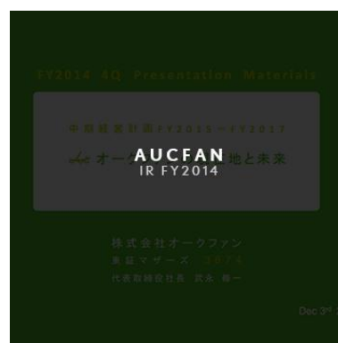
(株)オークファン 東証マザーズ 3674