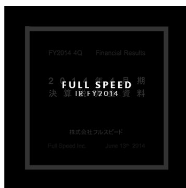
(株)フルスピード 東証マザーズ 2159