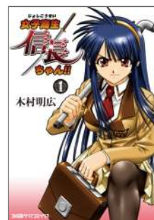
『女子高生信長ちゃん!!』