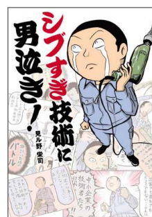
『シブすぎ技術に男泣き!』