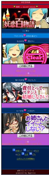
↑ イベント TOP