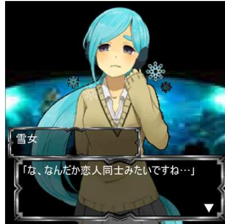
↑ 妖怪との会話場面