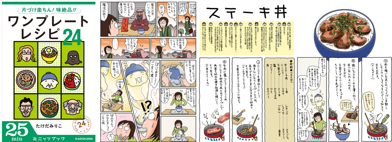
『片づけ楽ちん！ 味絶品！！ ワンプレートレシピ24』