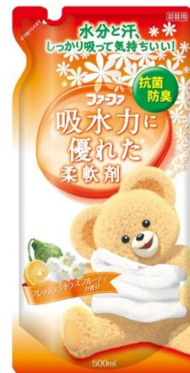
ファーフア吸水力に優れた柔軟剤 リッチホワイトフローラル