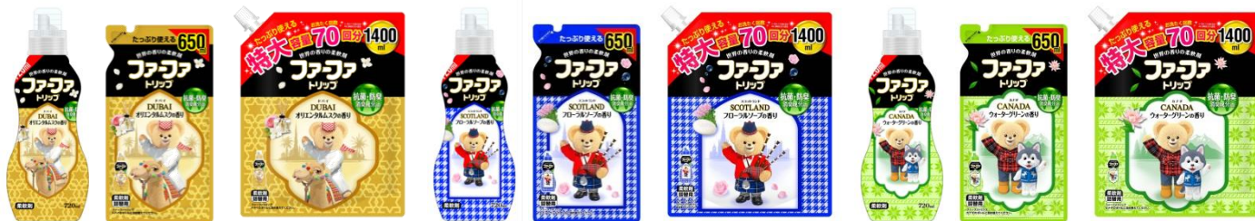
ファーフアトリップ ドバイ オリエンタルムスクの香り