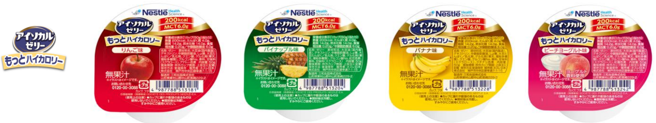
「アイソカル ゼリー もっとハイカロリー」左から:りんご味、パイナップル味、バナナ味、ピーチヨーグルト味

※1 ネスレ調べ [医療・介護現場へ販売されたカップゼリーの販売数量(2022年)より算出]