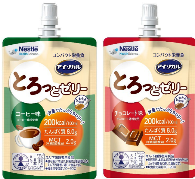
コンパクト栄養食 「アイソカル とろっとゼリー」

ネスレヘルスサイエンスは、食事中的飲み込みや誤嚥に不安のある方に対して、「アイソカル とろっとゼリー」や「アイソカルゼリー ハイカロリー」などの「えん下困難者用食品」を開発・販売し、栄養不足の解消や健康維持に貢献していきます。