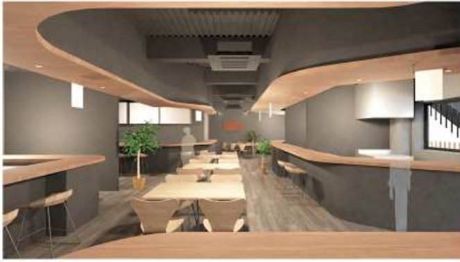
▲テナントD から共用部を見たイメージ