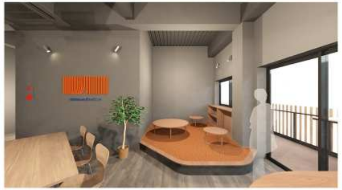
▲小上がり部分イメージ