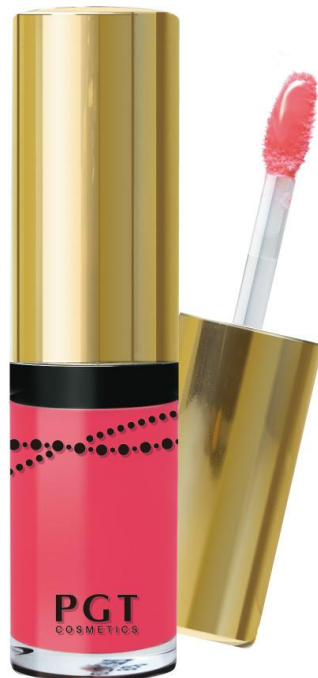
〈パルガントン リキッドリッチルージュ〉

(※2) アボカドオイル、アーモンドオイル、グレープシードオイル、グリーンティーシードオイル、オリーブオイル