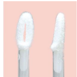
〈リキッドリッチルージュ チップ〉

メイクしながら、ケアしているような感覚。 うるおい美容液成分配合で、乾燥を防ぎます。