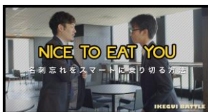
「NICE TO EAT YOU」