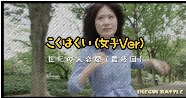
【ヨガワササノさん出演】「こくはぐい (女子Ver)」

スペシャルサイト「イケぐいバトル!!」URL : http://ikeguibattle.pringles.com/