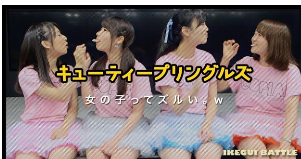
【Copia出演】「キューティープリングルズ」