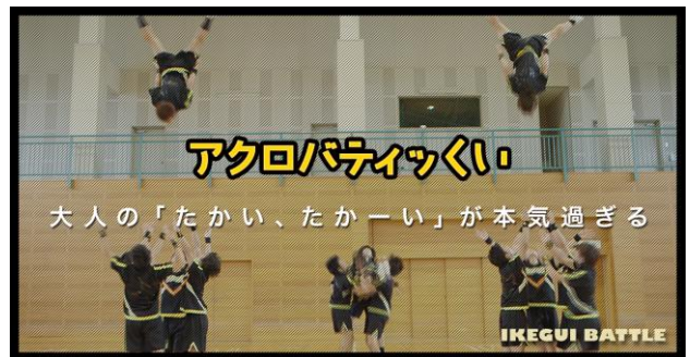
【SHOCKERS出演】「アクロバティックぐい」