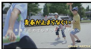
「青春が止まらなくぐい」