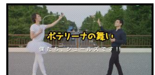
「ポテリーナの舞い」