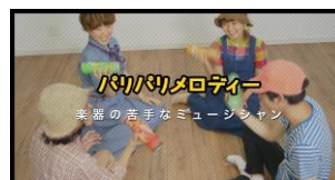
「パリパリメロディー」